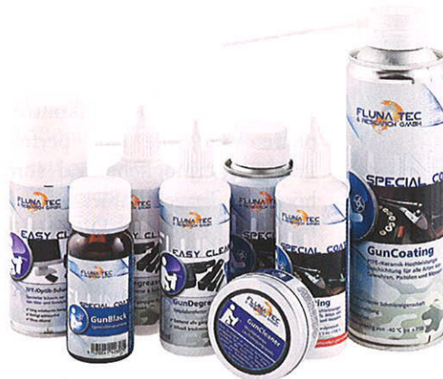
Pflegeprodukte von Fluna Tec basieren auf flüssiger Keramik