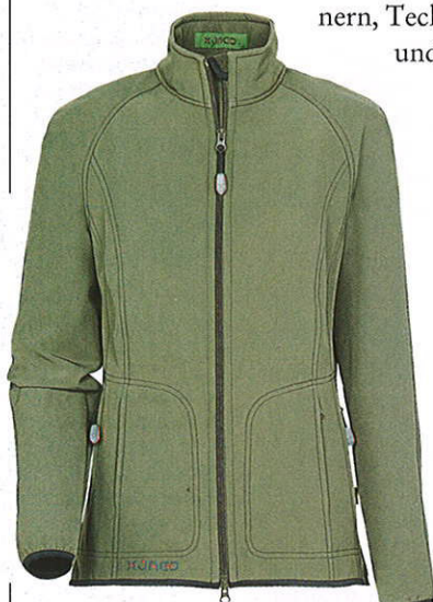
Damen-Softshelljacke Amarillo, Größen 34 bis 48, € 169,-