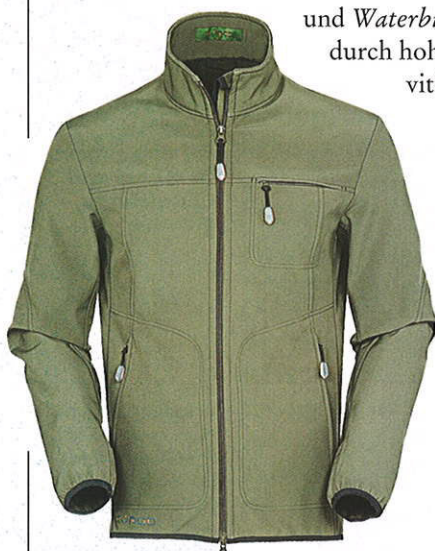
Herren-Softshelljacke Waterbury, Größen 46 bis 60, € 179,-